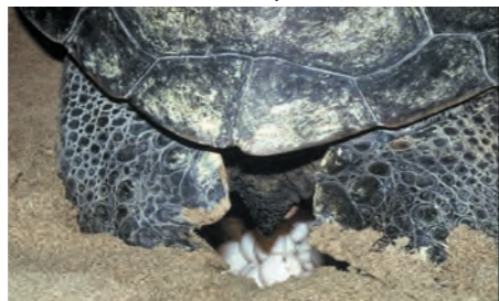
Πράσινη Χελώνα που γεννά