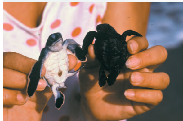
Πράσινο Χελωνάκι (άσπρη κοιλιά) καρέττα (μαύρο)

Καρέττα τρέφεται με διάφορα θαλάσσια ζώα όπως καβούρια, αχινούς, σφουγγάρια, μαλάκια και μέδουσες. Οι χελώνες μπορούν να ζήσουν περισσότερο από 60 χρόνια.