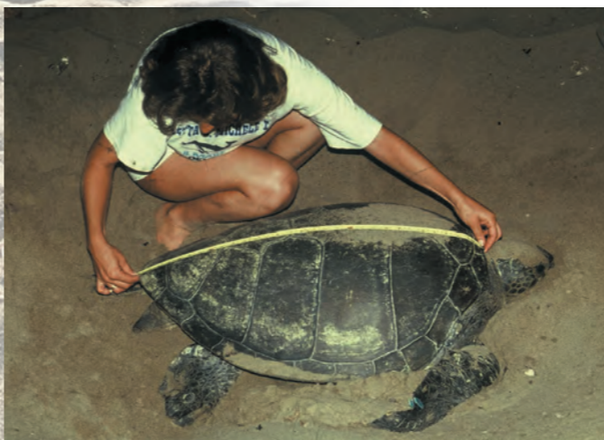
Μέτρηση Πράσινης χελώνας

Οι χελώνες γεννούν κάθε 2-5 χρόνια. Η Καρέττα Καρέττα γεννά κυρίως από το τέλος Μαΐου μέχρι τις αρχές Αυγούστου. Η Πράσινη Χελώνα αρχίζει και τελειώνει να γεννά δύο εβδομάδες αργότερα. Τη χρονιά δε που γεννούν, γεννούν 3 - 5 φορές, κάθε 14 μέρες περίπου. Η Καρέττα γεννά γύρω στα 80 αυγά σε κάθε φωλιά, σε βάθος 30-50 εκ. περίπου. Η Πράσινη χελώνα γεννά γύρω στα 120 αυγά σε βάθος 50-80 εκ. περίπου. Τα αυγά έχουν μαλακό κέλυφος. Μετά την τοποθέτηση των αυγών, η χελώνα σκεπάζει με άμμο τη φωλιά με πολλή υπομονή και προσοχή προτού επιστρέψει στη θάλασσα. Τα αυγά εκκολάπτονται με τη ζέση του ήλιου σε 7 εβδομάδες περίπου. Τα μικρά χελωνάκια αναδύονται από την άμμο κατά τη διάρκεια της νύχτας. Το φύλο καθορίζεται από τη θερμοκρασία της άμμου. Ψηλές θερμοκρασίες παράγουν θηλυκά χελωνάκια και χαμηλές, αρσενικά. Γύρω στους 29-30°C τα μισά χελωνάκια είναι αρσενικά και τα μισά θηλυκά.