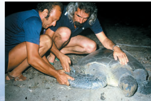
Σημάδεμα Πράσινης Χελώνας

στην ξηρά για να γεννήσουν τα αυγά τους. Για τον ίδιο λόγο, οι χελώνες αναπνέουν με πνεύμονες, αν και μπορούν να κρατήσουν την αναπνοή τους για πολλή ώρα. Στα πρώτα τους χρόνια, οι μικρές χελώνες και των δύο ειδών, τρέφονται με πλαγκτονικούς οργανισμούς, μέδουσες, μαλάκια κ.ά. Οι Πράσινες Χελώνες, όταν μεγαλώσουν, τρέφονται με δύο είδη "φυκιών" που είναι στην πραγματικότητα αγγελιόσπερμα και όχι φύκια, την Ποσειδώνια ( Posidonia oceanica ) και την Συμωτόσεια ( Cymodocea nodosa ). Η