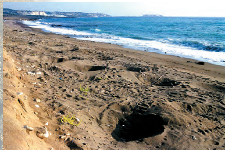
Αναπαραγωγική δραστηριότητα Πράσινων χελώνων στην Τοξεύτρα